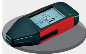
Загрузочный ключ DLKPro TIS-Compact®