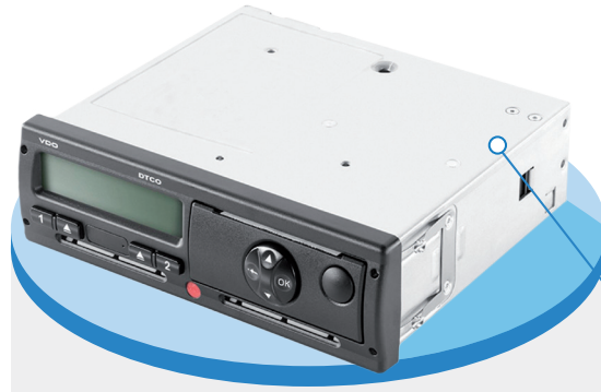
Тахограф VDO DTCO®