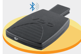
Устройство Smart Link®